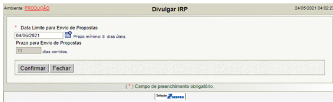
Figura 1 - Divulgar IRP

II) Após a inserção e confirmação da data limite, será aberto um resumo da IRP. O Órgão Gerenciador deverá selecionar a caixa, declarando ter dado ciência à autoridade competente do órgão da divulgação de compra por Registro de Preços (Figura 2).