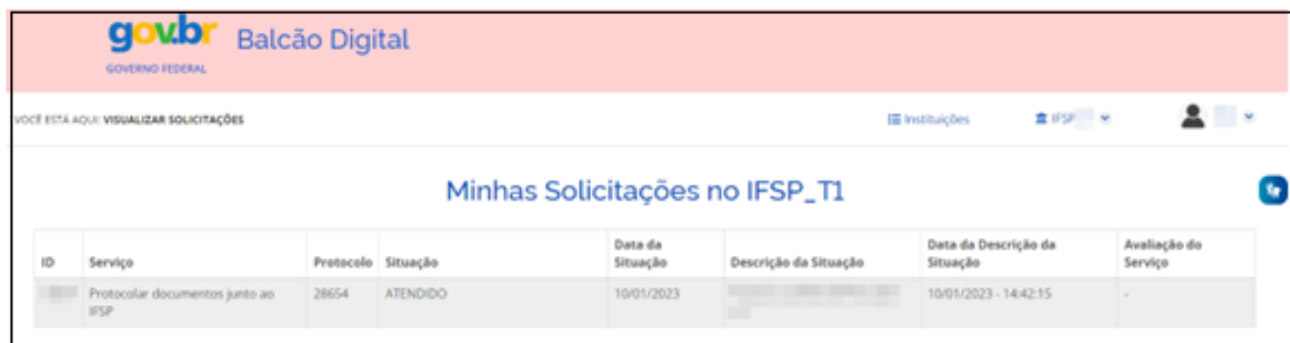
Figura - 15

“Demonstração das telas em "gif". Clicar sobre a imagem para assistir com melhor qualidade de resolução: