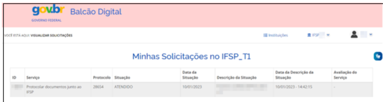
Figura - 15

“Demonstração das telas em "gif". Clicar sobre a imagem para assistir com melhor qualidade de resolução: