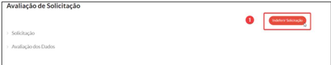
Figura - 10

Use modelos de texto padronizados para auxiliar no retorno ao cidadão sobre o indeferimento de sua solicitação