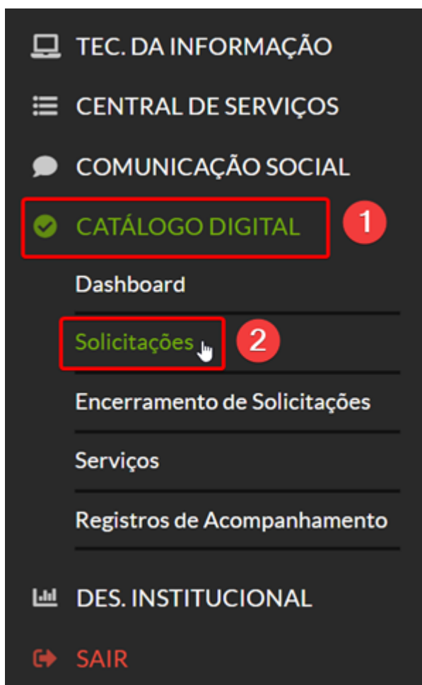
Figura - 1

1. Acessar o Suap, selecionar o módulo “Catálogo Digital 1 ” e clicar em “Solicitações 2 ”.