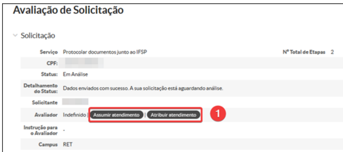
Figura - 3

4. Analisar todos os campos preenchidos e alterar de “Aguardando Avaliação” para uma das seguintes situações: OK ou CP (Com Problema)