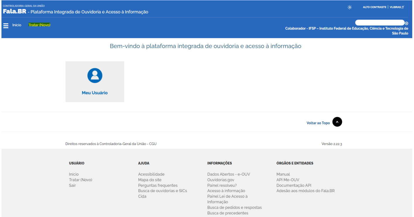
Figura 3 - Tela inicial da plataforma para o perfil "Colaborador".