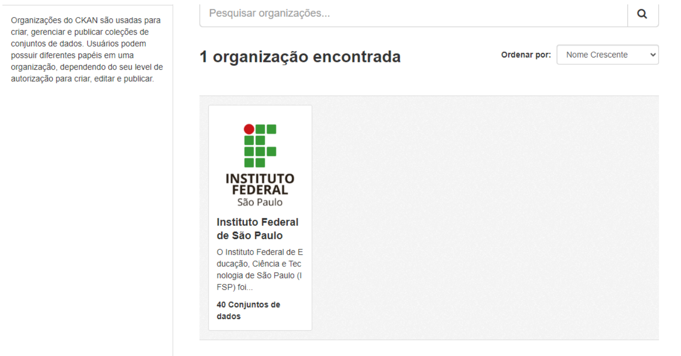
Figura 2 - Grupos.