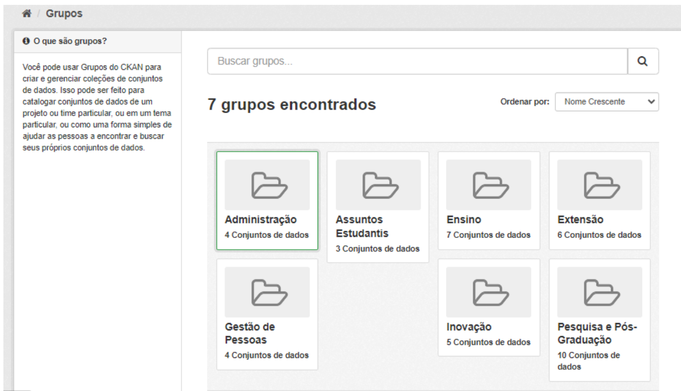
Figura 3 - Conjuntos.