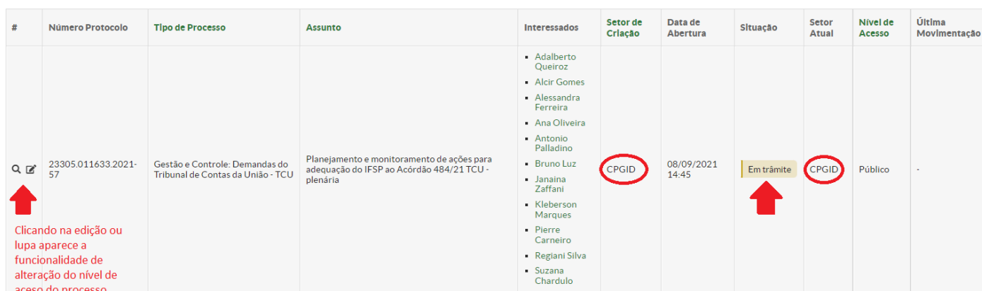
Figura - 1