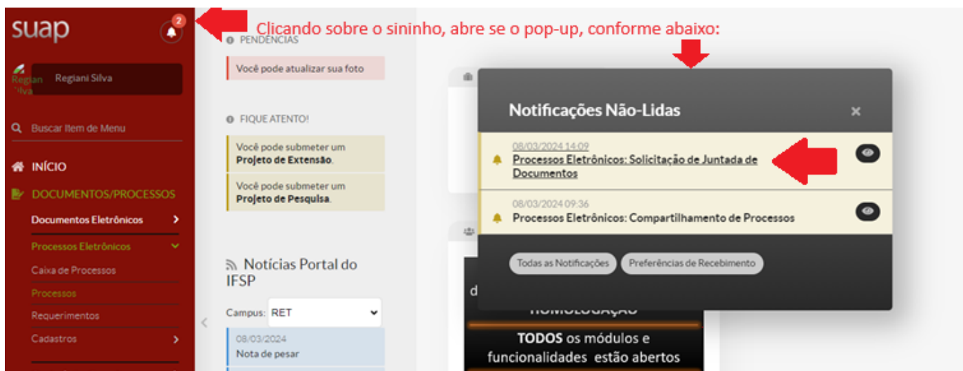
Figura - 2