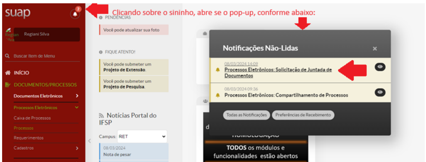
Figura - 2