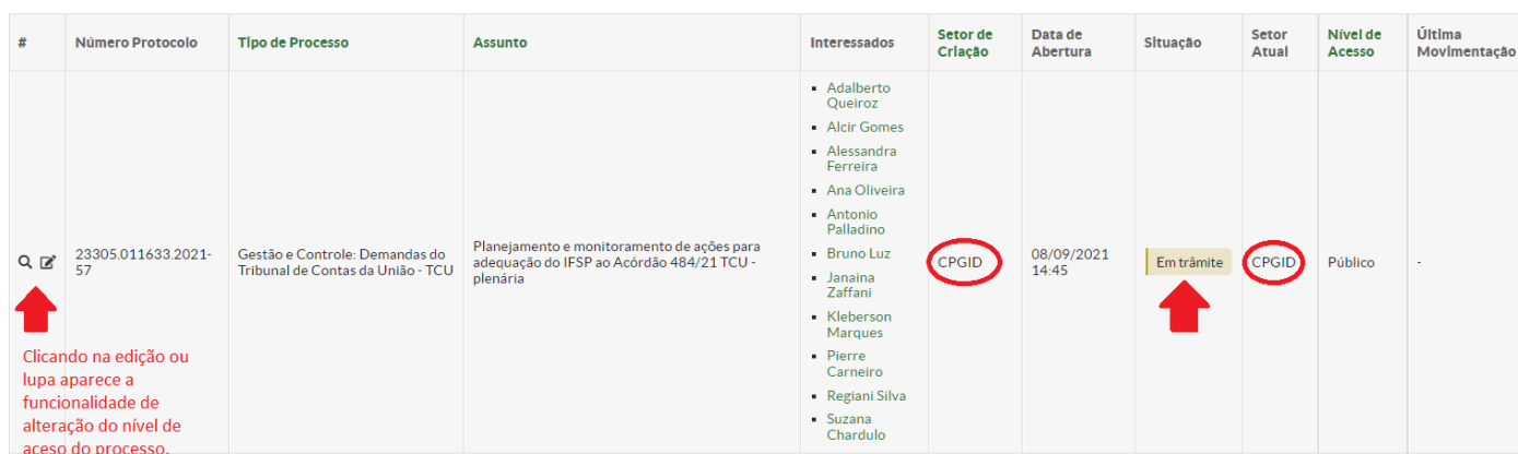
Figura - 1