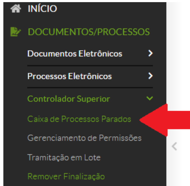
Figura - 6