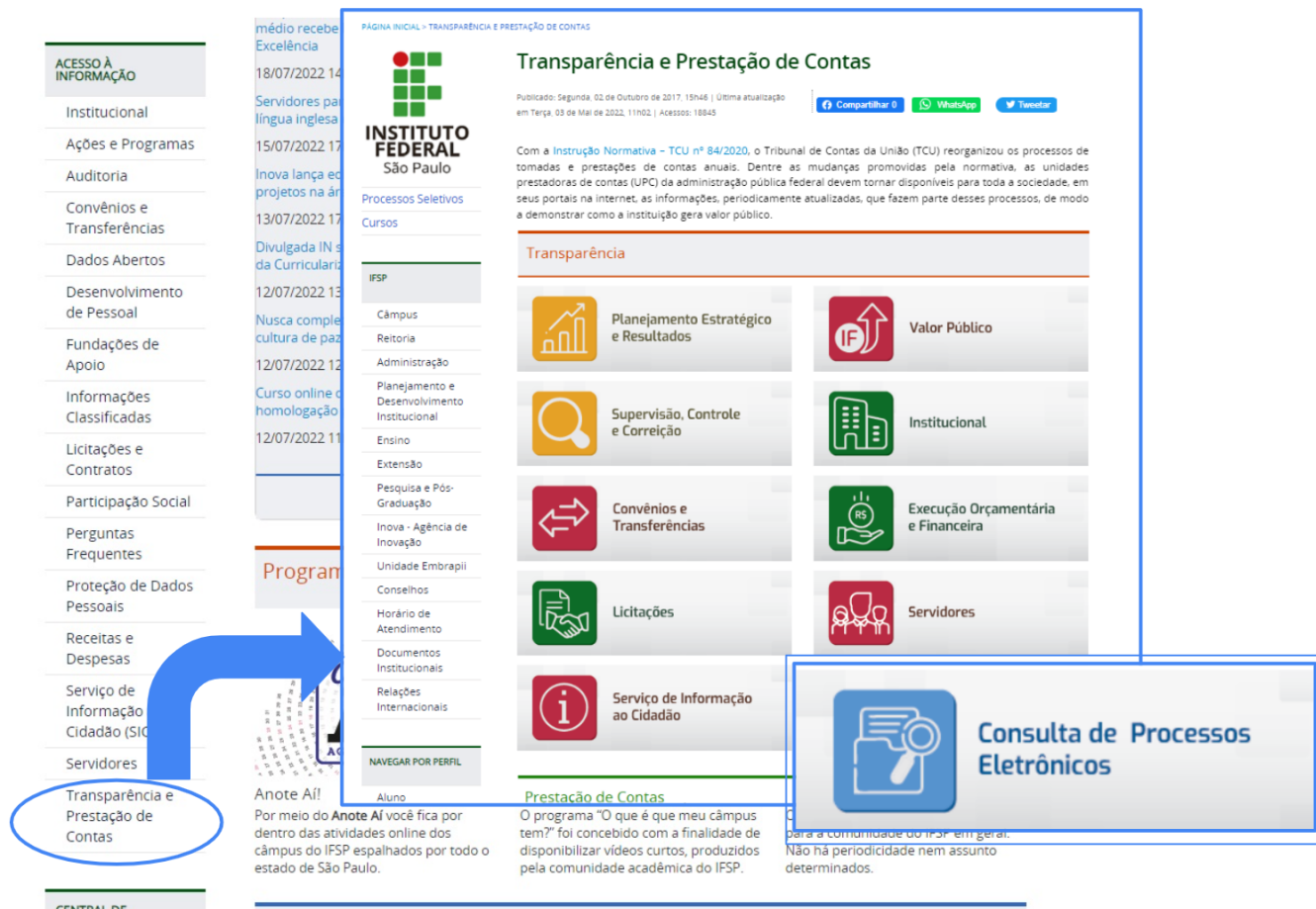
Figura - 3

Ao clicar no link à frente, abrir-se-á a lista de botões dentro da Transparência e Prestação de Contas na seção de Acesso à Informação .