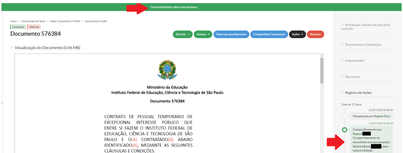
Figura - 7

3.1.3 Ao clicar novamente no botão " Compartilhar Documento ", a janela de " Gerenciamento de Compartilhamento de Documento " aparecerá e poder-se-á visualizar a lista dos setores e