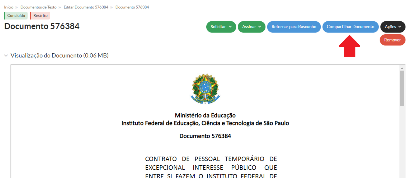
Figura - 3